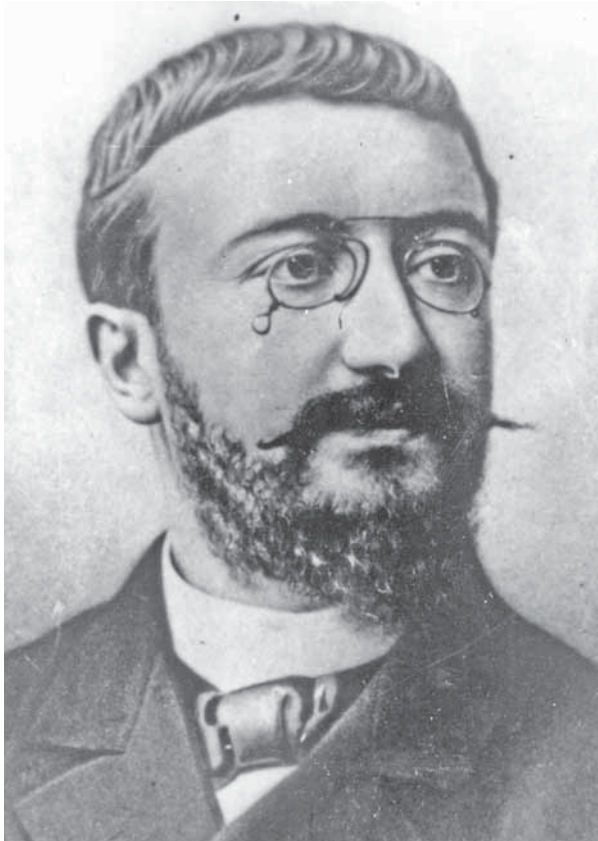
Alfred Binet (1857-1911).